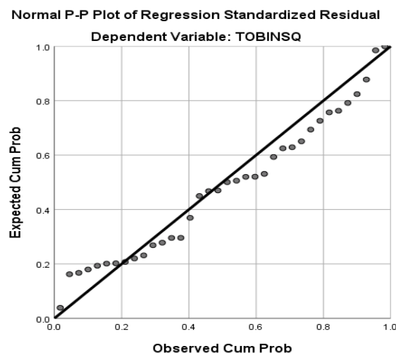
Gambar 2 Hasil Uji Normalitas Sumber: Data sekunder diolah, 2024

Berdasarkan gambar 2 grafik probability plot dapat diketahui bahwa terdapat titik-titik berada disekitar garis diagonal sehingga dapat dinyatakan bahwa residual data telah didistribusikan normal dan model regresi dinyatakan dapat memenuhi asumsi normalitas.