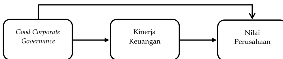
Gambar 1 Rerangka Konseptual