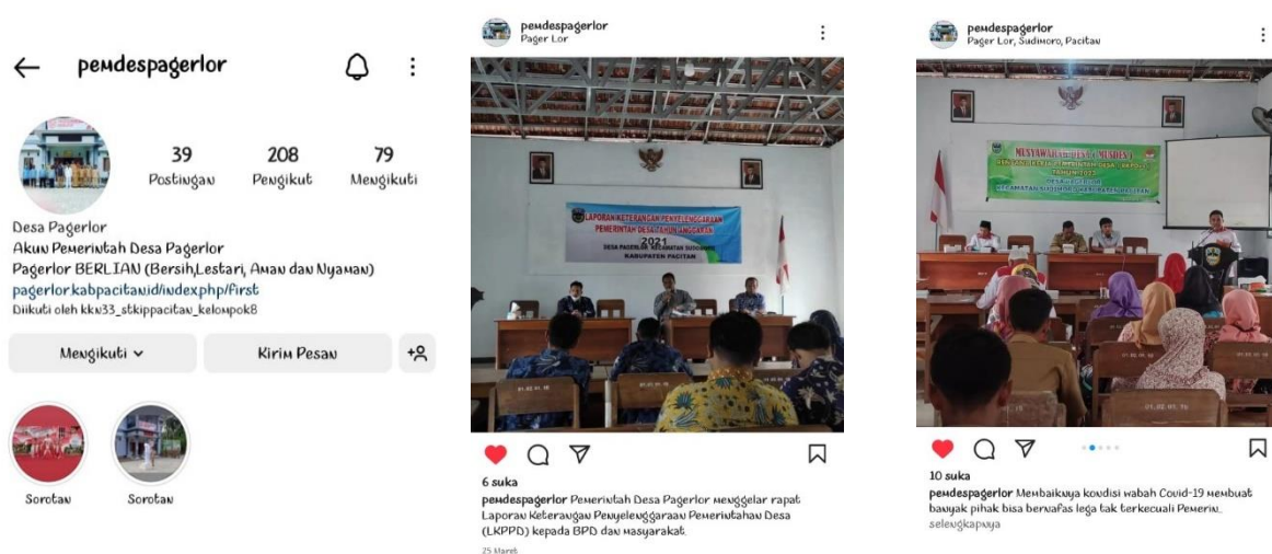
Gambar 3 Foto tampilan Instagram Desa Pager Lor

Dalam penerapan transparansi Pemerintah Desa PagerLor juga membuat media social sebagai sarana penyebaran informasi kegiatan Pemerintah Desa, yaitu melalui media Instagram dengan akun @pemdespagerlor dan website khusus Desa Pager Lor dengan alamat https://pagerlor.kabpacitan.id/ . Berikut tampilan sarana informasi Desa Pager Lor: