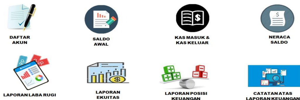
Gambar 2 Modul Laporan Keuangan