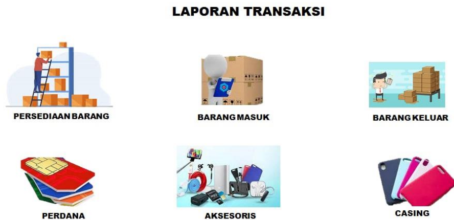
Gambar 1 Modul Transaksi Sumber: Data Penelitian Diolah, 2022

Modul transaksi memuat informasi terkait jumlah persediaan barang dan terkait penerimaan uang terkait aktifitas Berkah 88 Cell. Modul transaksi berisi enam menu yakni persediaan barang, barang masuk, barang keluar, perdana, aksesoris dan casing. Setiap icon akan langsung terhubung dengan menu terkait.