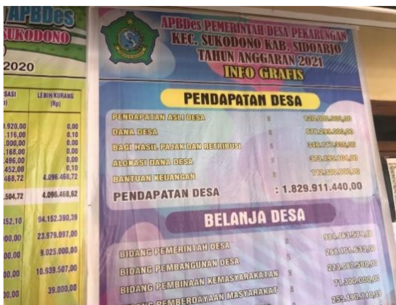
Gambar 4 Laporan Pengelolaan Dana

Dari hasil wawancara yang dilakukan dengan Informan 2 Bapak Erwanto selaku Sekretaris Desa di Desa Pekarungan Kabupaten Sidoarjo menunjukkan bahwa pengelolaan dana desa transparan, namun LPJ masih belum selesai atau sedang dalam proses. Hal ini didukung dengan adanya bukti dokumentasi yang didapatkan peneliti dalam gambar berikut ini.